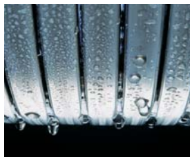
Inox-Radial-Wärmetauscher – langlebig und effizient