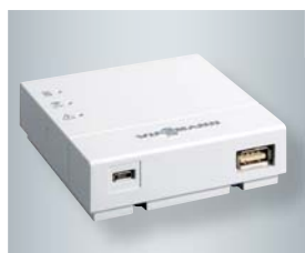
Vitoconnect 100 mit Anschlüssen für das Steckernetzteil (links) und zur Datenverbindung